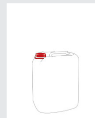
Kanister 5 l Art.-Nr.: 2005148