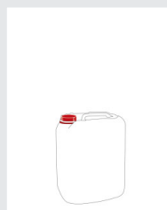
Kanister 5 l Art.-Nr.: 2003631